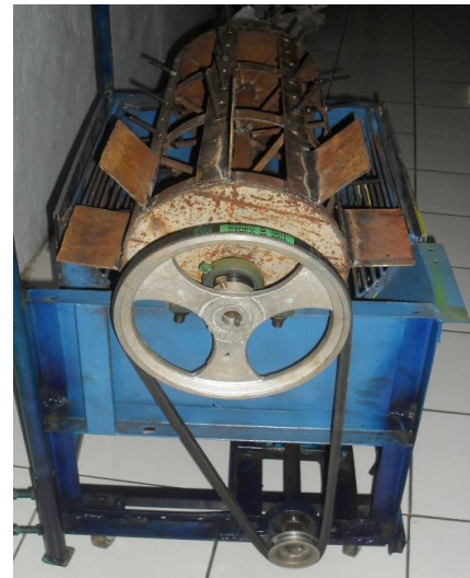
Gambar 1 Gigi Mesin Perontok Padi Portabel

dengan lainnya. Panjang gigi perontok sekitar 60 mm dan jarak antar gigi 60 mm, seperti pada Gambar 1.