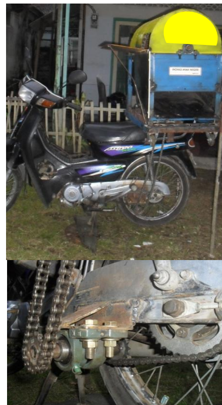
Gambar 2 Mesin Perontok Padi (atas) Desain Portabel; Gear Penggerak (bawah)

Alat ini menggunakan mesin sepeda motor sebagai penggerak seperti pada Gambar 2, namun tanpa merubah konstruksi sepeda motor. Artinya, sepeda motor tetap bisa digunakan sebagai alat transportasi, jika alat perontok padi dilepas. Sehingga alat perontok padi didesain portable agar mudah dibongkar pasang pada sepeda motor.